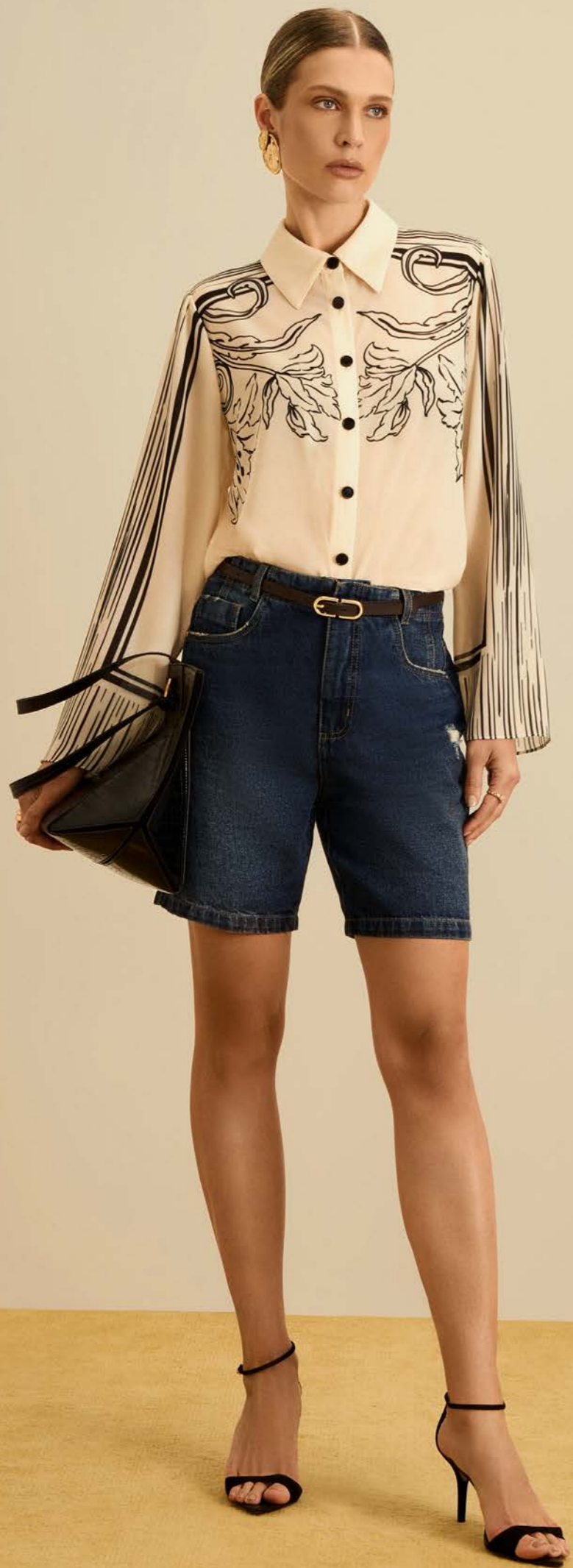
CAMISA 12000110161 BERMUDA 12000204854