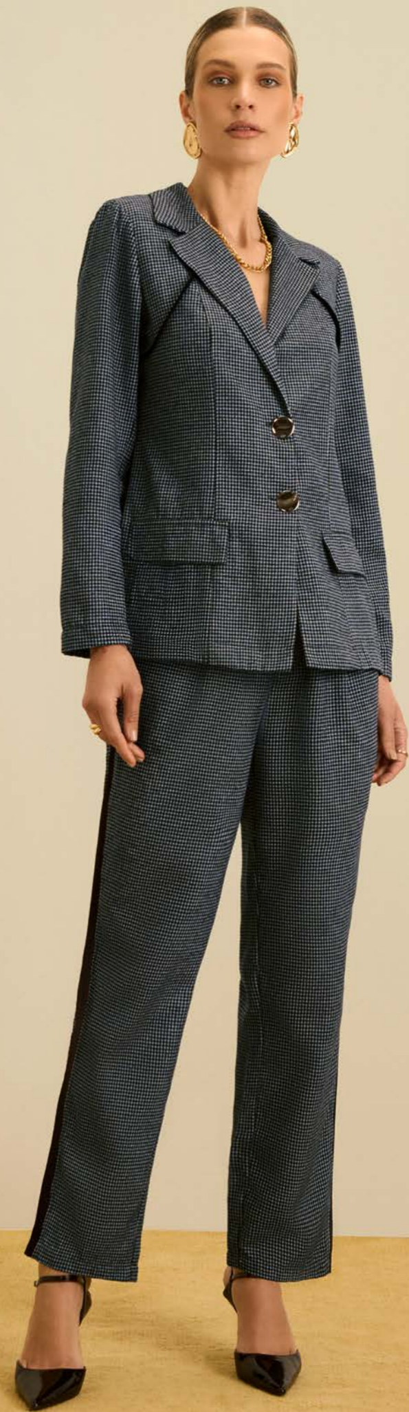
BLAZER 12000110113 MARROM - 48 MARINHO - 998697 CALÇA 12000110114 PRETO - 10 BEGE - 15