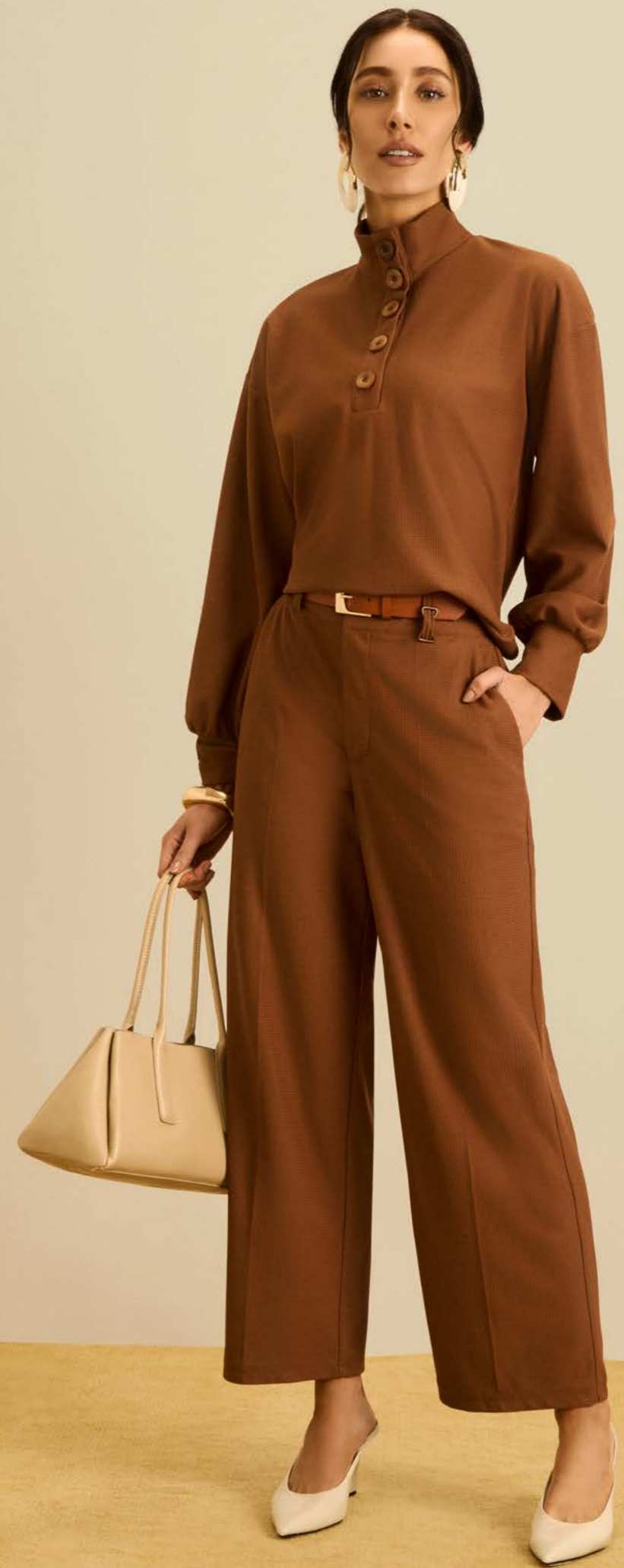
BLUSA 12000110059 CALÇA 12000110055 CONJUNTO 12000110324 A CALÇA faz conjunto com a BLUSA da página 72.