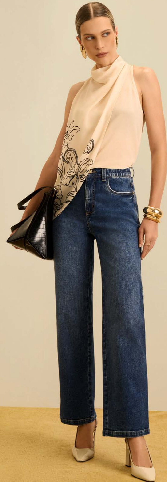
BLUSA 12000110162 CALÇA 12000204846