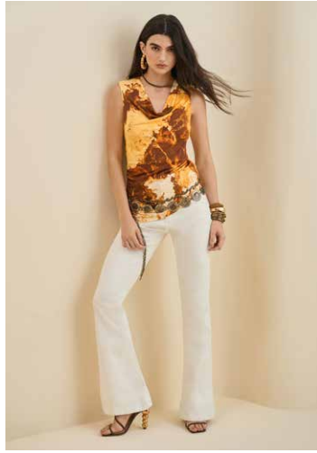
BLUSA 10000119830 CALÇA 10000206943