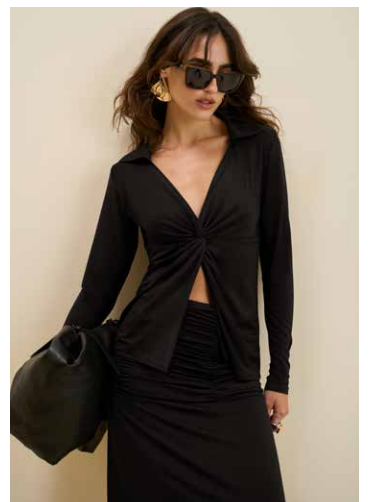
BLUSA 10002700664 SAIA 10002700662