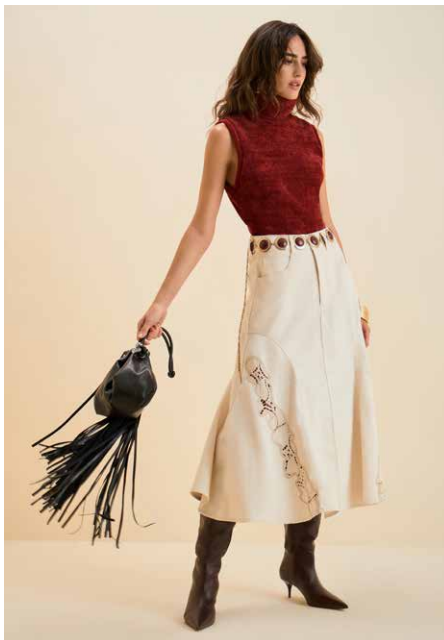
TOP 10000206887 CALÇA 10000206890 SAIA 10000206871