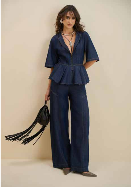
BLUSA 10000206992 CALÇA 10000206928