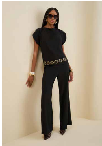
BLUSA 10000119807 CALÇA 10000119805