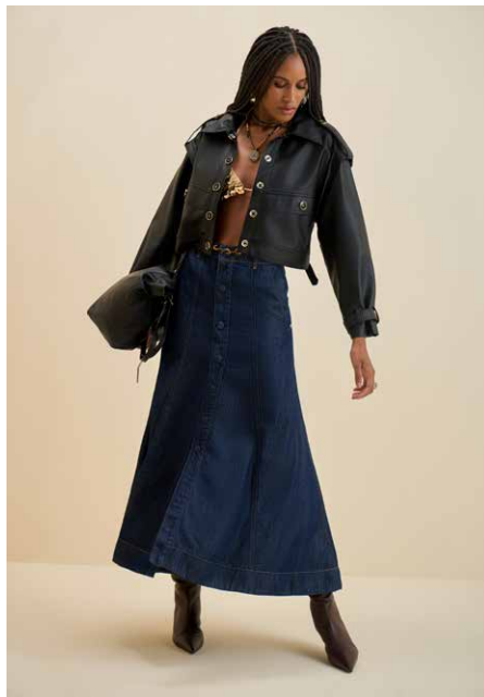
BLUSA 10000206996 SHORTS 10000206991 SAIA 10000206949