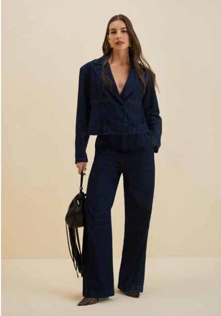
BLAZER 10000206963 CALÇA 10000206977