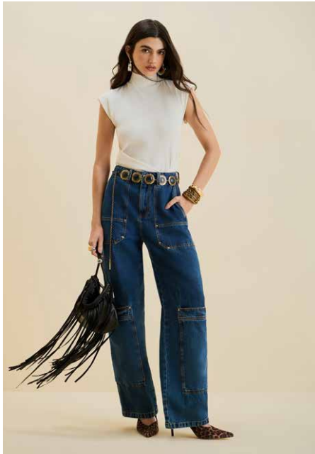
TOP 10000206936 CALÇA 10000206964