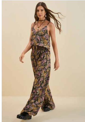
REGATA 10000119727 CALÇA 10000119725