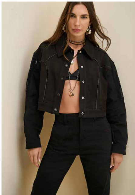
SHORTS 10000206925 JAQUETA 10000206951