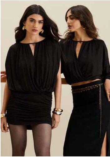
VESTIDO 10002700665 BLUSA 10002700663