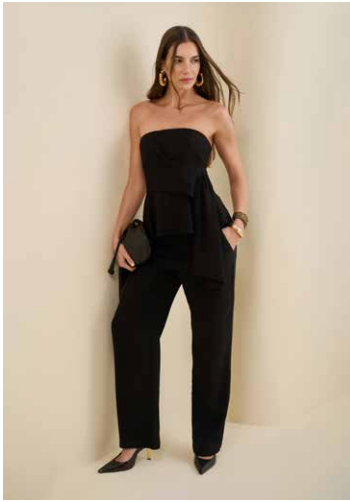
TOP 10000119845 CALÇA 10003400008