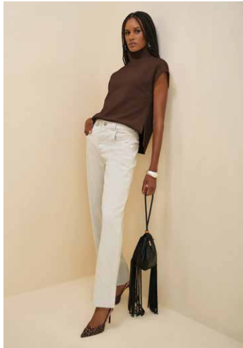
BLUSA 10001700777 CALÇA 10000206916