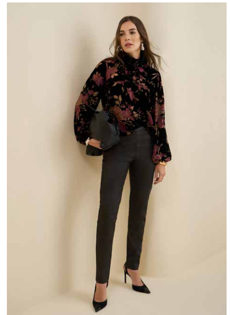
JAQUETA 10000206970 SAIA 10000206971 CALÇA 10000206987 CALÇA 10000206987