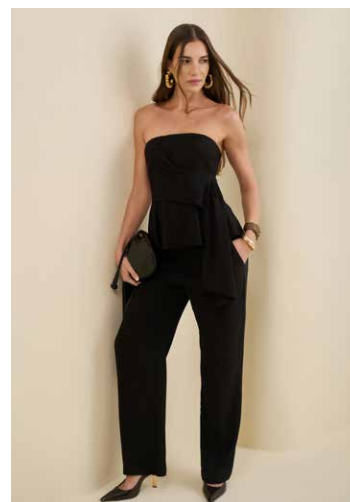
REGATA 10000119845 CALÇA 10003400008