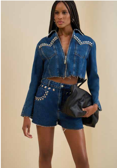
SHORTS 10000206950 JAQUETA 10000206989