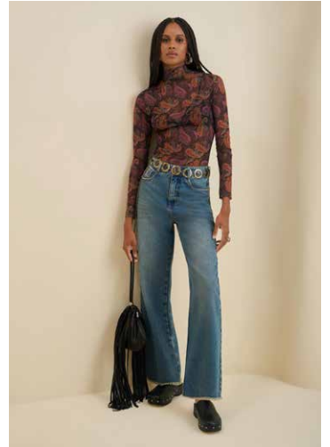
BLUSA 10002700656 CALÇA 10000206988