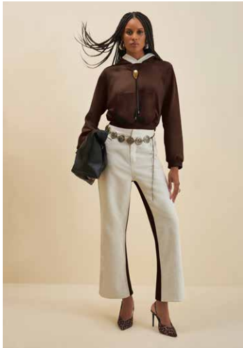
BLUSA 10001700776 CALÇA 10000206922